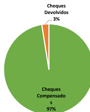
Gráfico 2 - Evolução dos Cheques – Valores (%) – 2016